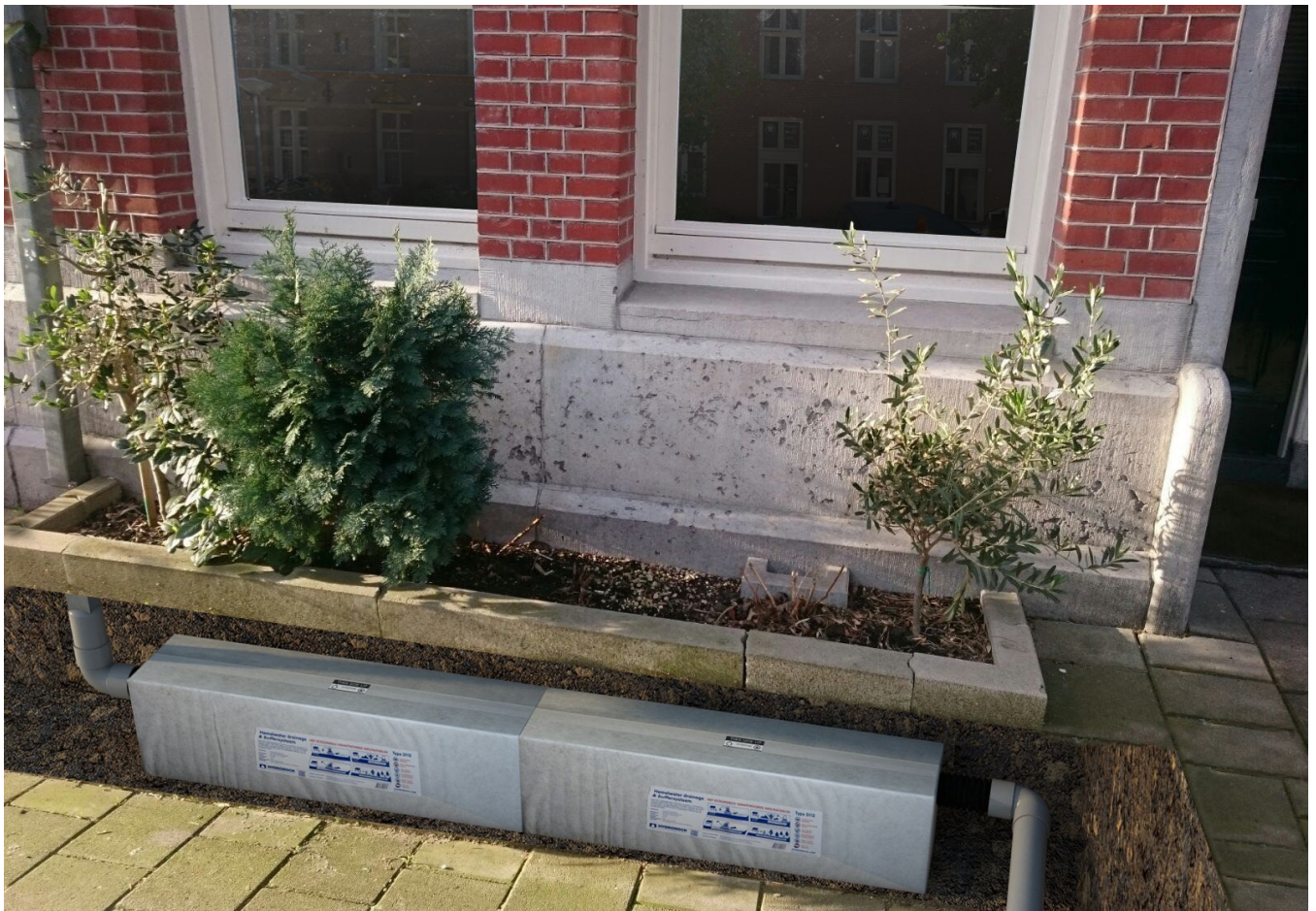
Infiltratieblokken onder een geveltuintje.