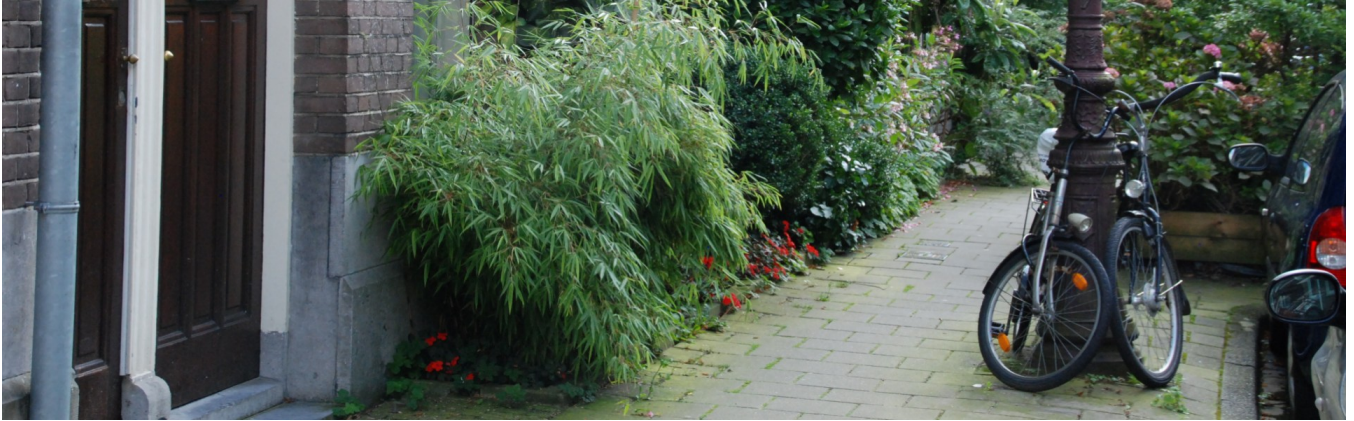
Geveltuintjes in Zuid

Door een rij tegels te verwijderen langs de gevel aan de straatkant en hier een tuintje aan te leggen, kan het van de gevel afstromende regenwater in de grond infiltreren. Daarnaast dragen geveltuinen bij aan een groener straatbeeld.