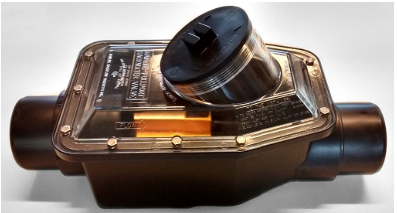
Een terugslagklep.